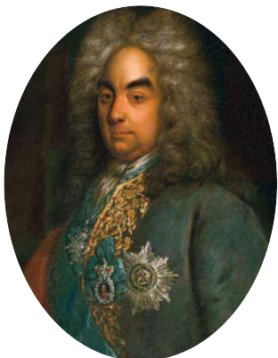
Петр Андреевич Толстой