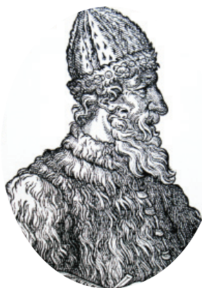
Великий князь Иван III

До XVIII века чиновники на Руси жили благодаря так называемым «кормлениям», то есть, при отсутствии оклада за исправление должности, разрешению на подношения от заинтересованных в их деятельности лиц. Одаривали их не только деньгами, но и «натурой» — мясом, рыбой, пирогами и пр., что было делом обыкновенным.